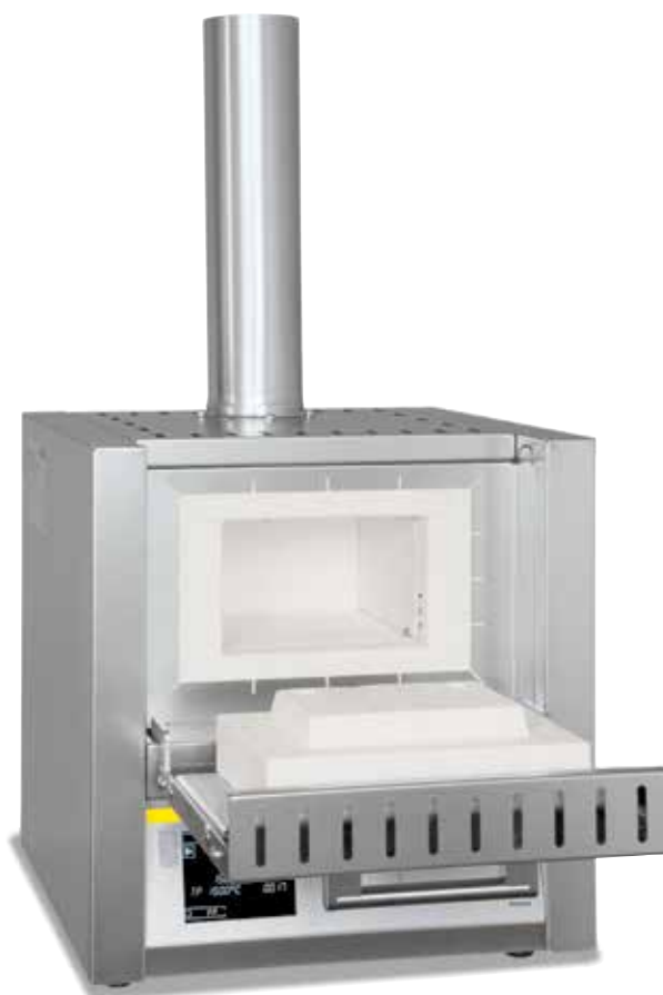
Horno de incineración LV 3/11

Los hornos de incineración LV 3/11 - LVT 15/11 están especialmente diseñados para la incineración en laboratorios. Un sistema especial de aire de escape y aire adicional permite más de 6 cambios de aire por minuto. El aire entrante se precalienta de modo que se asegure una buena homogeneidad de la temperatura.