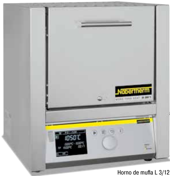
Horno de mufla L 3/12