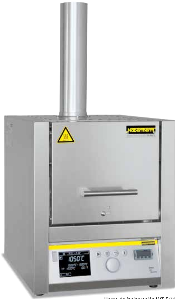
Horno de incineración LVT 5/11