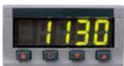
Limitador de selección de temperatura