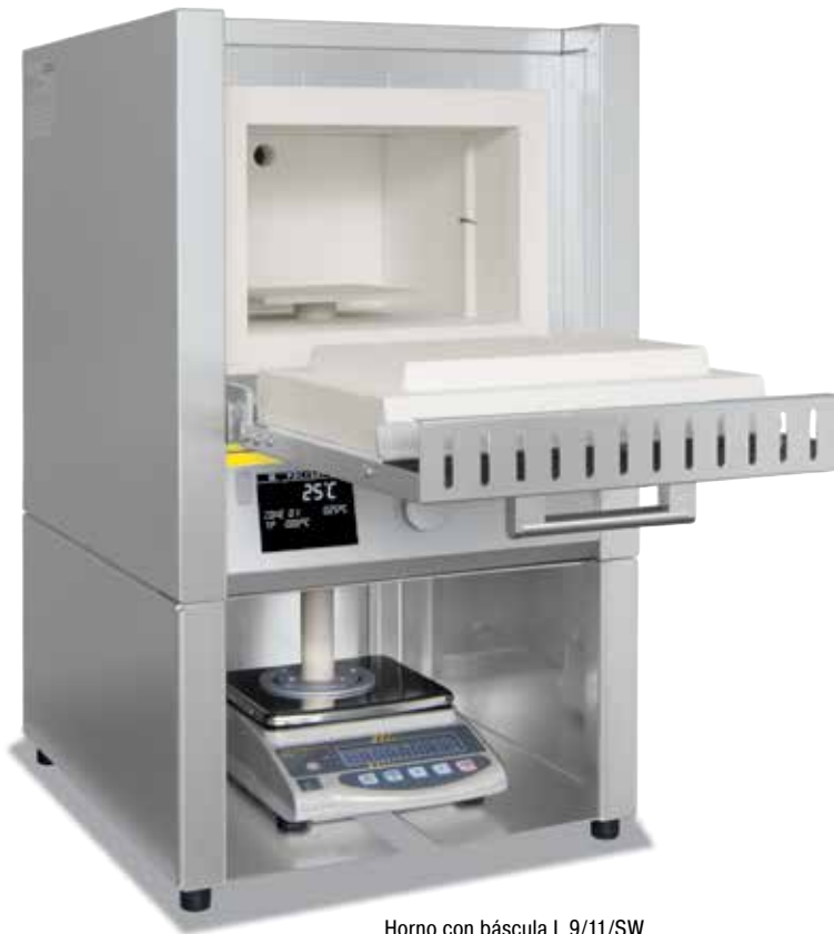
Horno con báscula L 9/11/SW