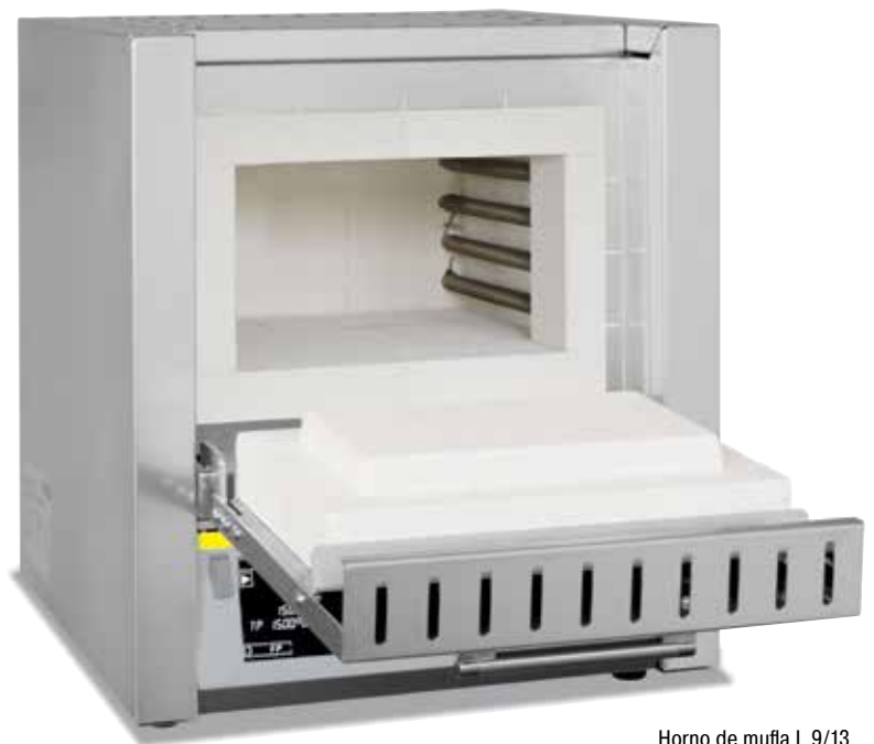
Horno de mufla L 9/13

Por medio de los elementos calefactores enfilados en los tubos de soporte de radiación libre en la cámara del horno logran estos hornos de mufla tiempos de calentamiento especialmente cortos. Con su robusto aislamiento de ladrillos refractarios, se consiguen temperaturas máximas de trabajo de 1300 °C. Por consiguiente, estos hornos de mufla representan una interesante alternativa a los conocidos modelos a partir del L(T) 3/11 cuando se requieren tiempos de calentamiento especialmente cortos o de temperaturas de aplicación elevadas.