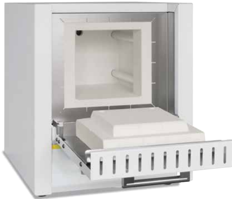
Horno de mufla LE 6/11

Con su imbatible relación rendimiento-precio, estos hornos de mufla compactos son aptos para muchas aplicaciones en laboratorio. Las características de calidad como la carcasa del horno de pared doble de acero fino inoxidable, la estructura ligera y compacta o los elementos calefactores incorporados en los tubos de vidrio cuarzoso hacen de estos modelos sus socios de confianza para sus aplicaciones.