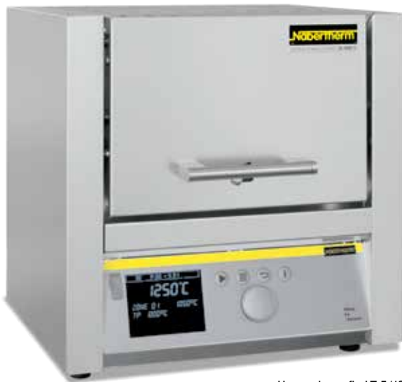
Horno de mufla LT 5/13