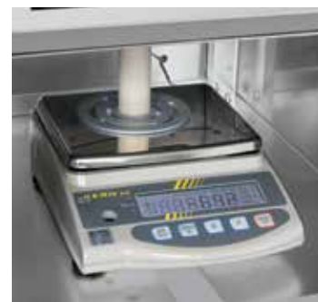
Pueden elegirse 4 básculas para diferentes pesos máximos y rangos de escala