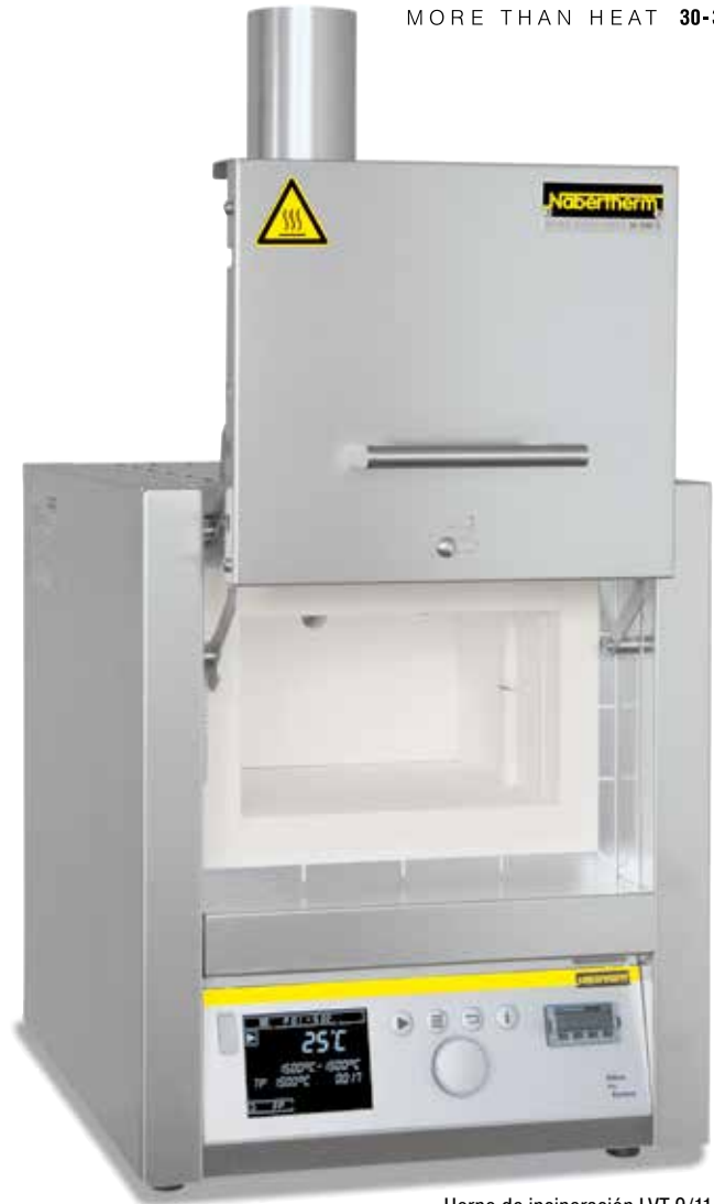
Horno de incineración LVT 9/11