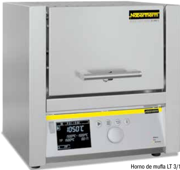
Horno de mufla LT 3/11