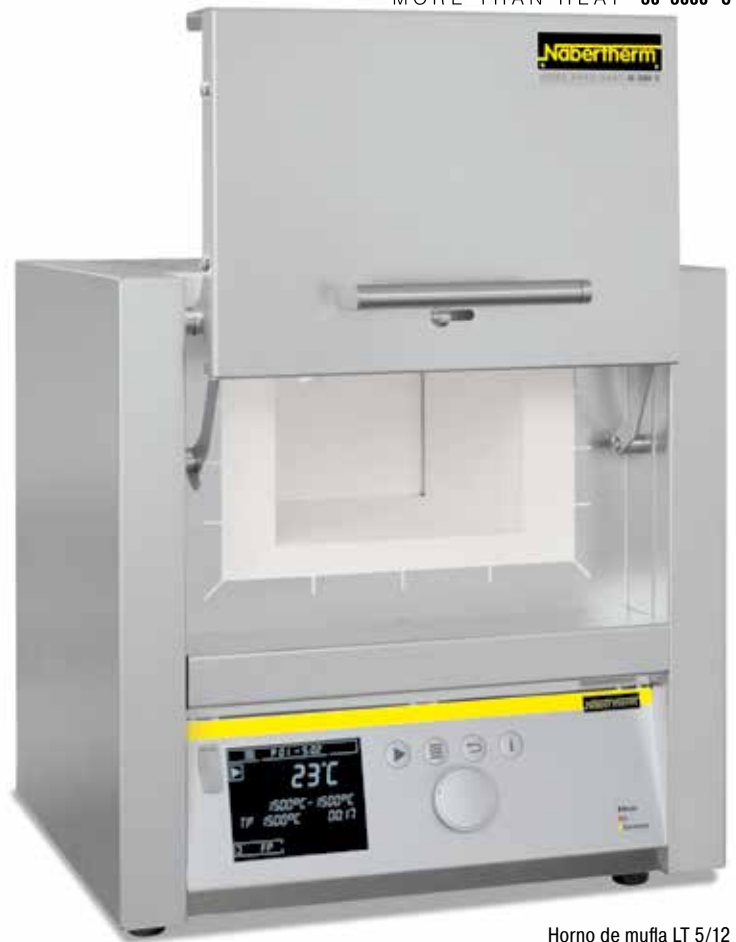
Horno de mufla LT 5/12