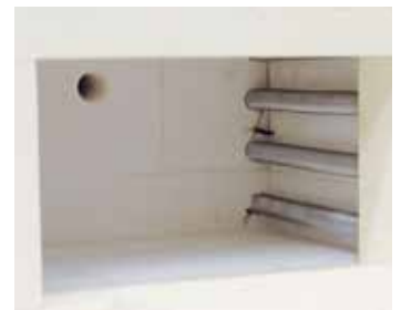
Interior del horno con aislamiento de ladrillos refractarios de alta calidad