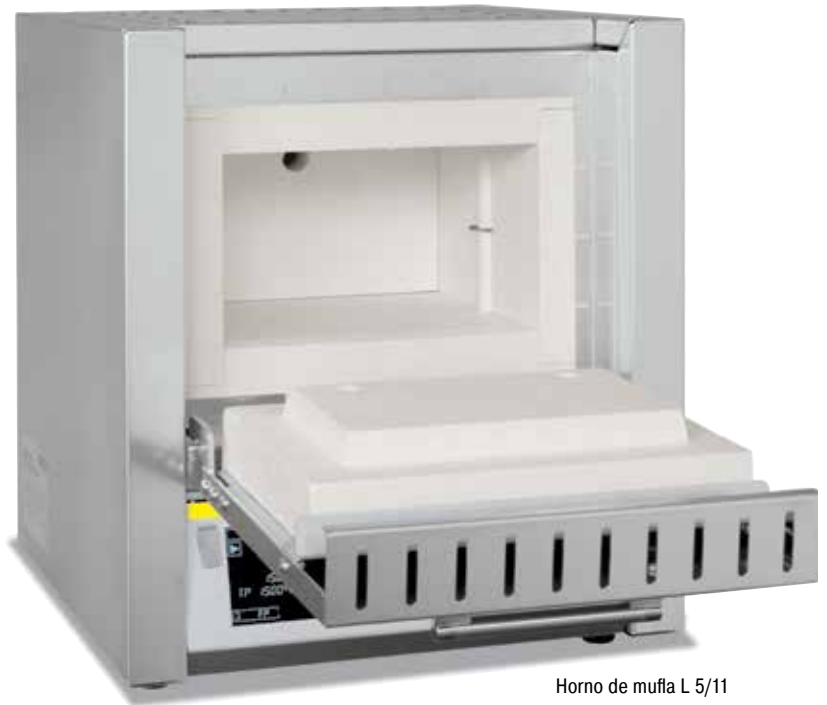
Horno de mufla L 5/11

Para el uso diario en el laboratorio, los hornos de mufla L 1/12 - LT 40/12 son la elección correcta. Esta línea de modelos se distingue por el tratamiento excelente, el moderno y excepcional diseño y un alto grado de eficacia. Los hornos de mufla están disponibles facultativamente y sin sobreprecio con puerta abatible o puerta de elevación.