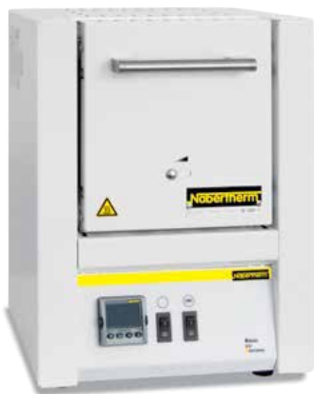
Horno de mufla LE 1/11