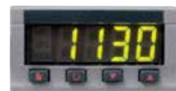
Limitador de selección de temperatura