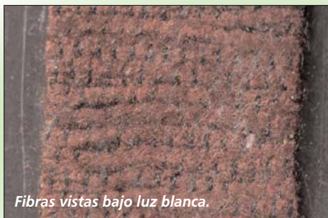
Fibras vistas bajo luz blanca.