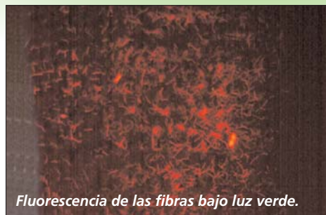
Fluorescencia de las fibras bajo luz verde.