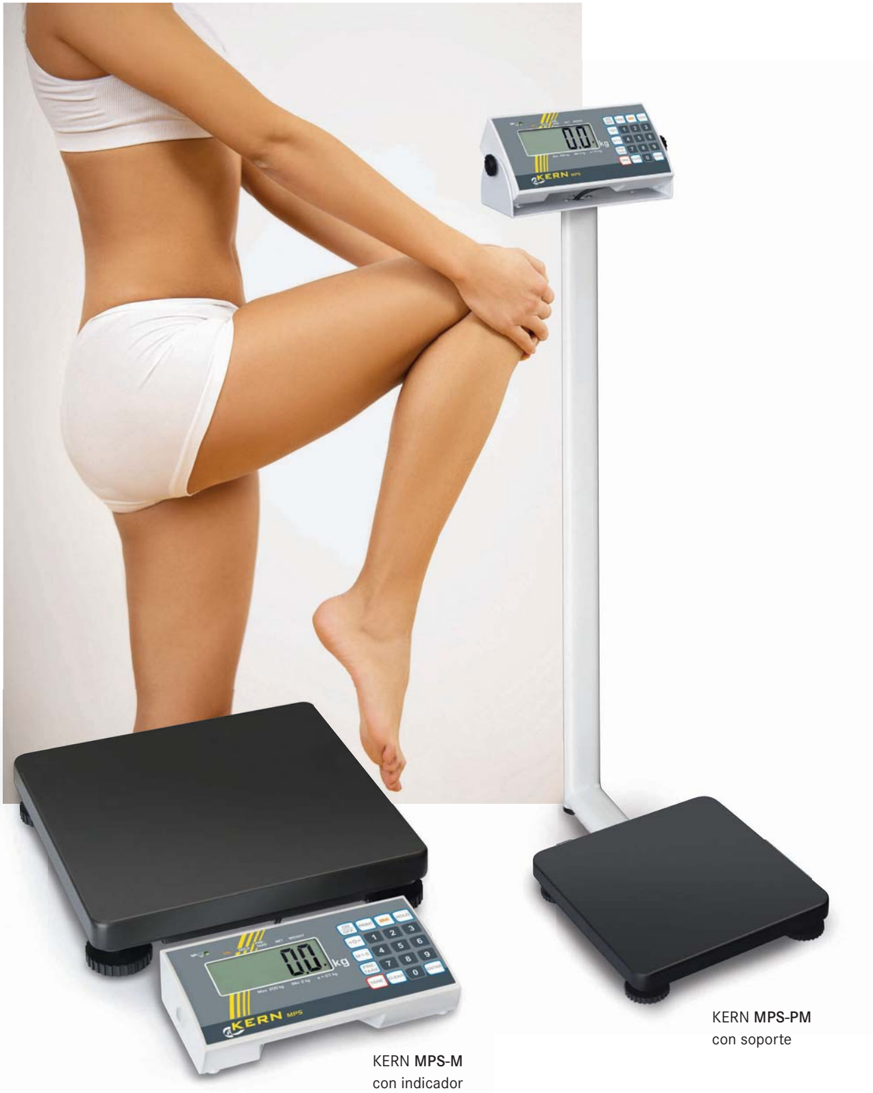
KERN MPS-M con indicador independiente